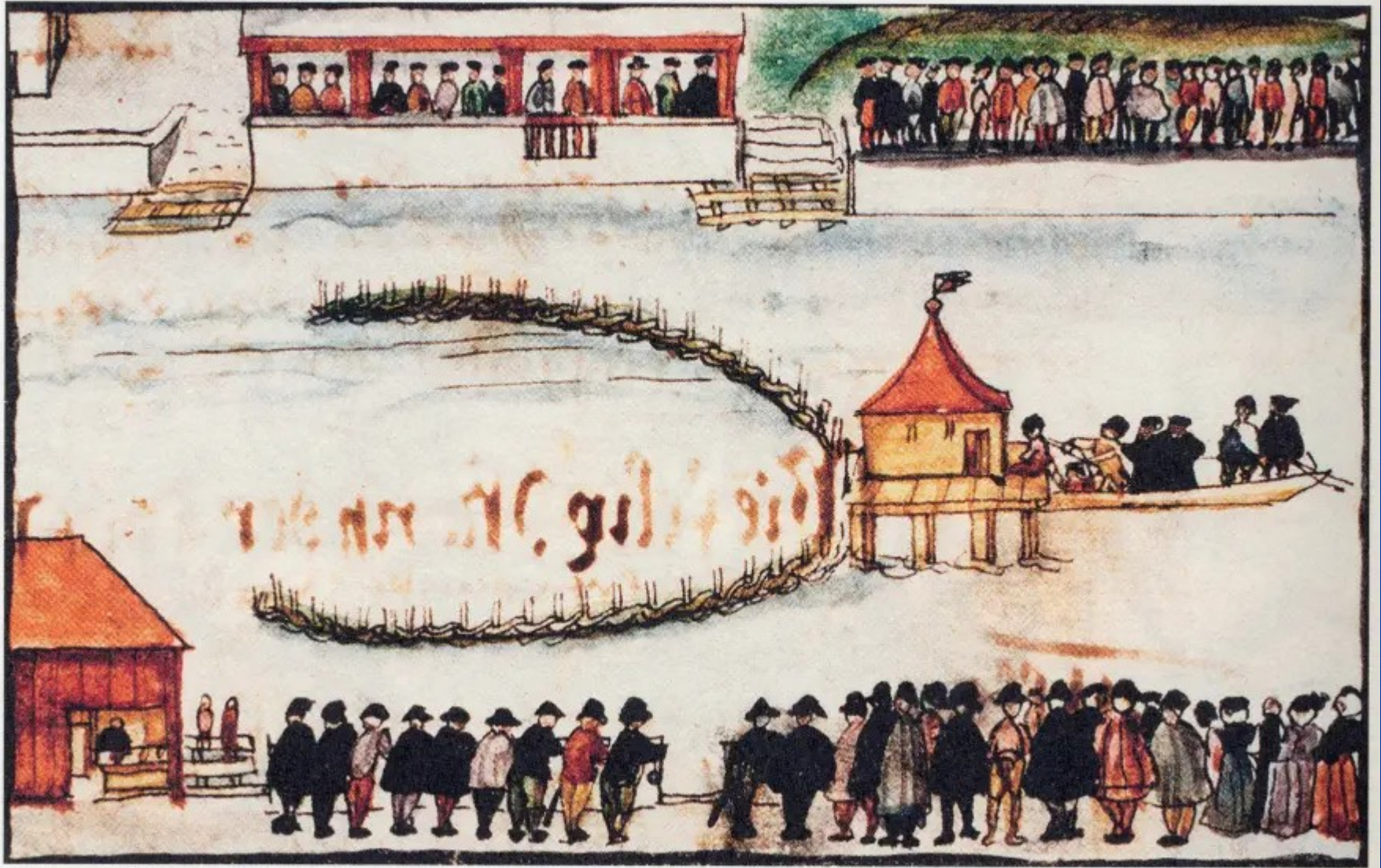
Exécution de Félix Manz, 1527