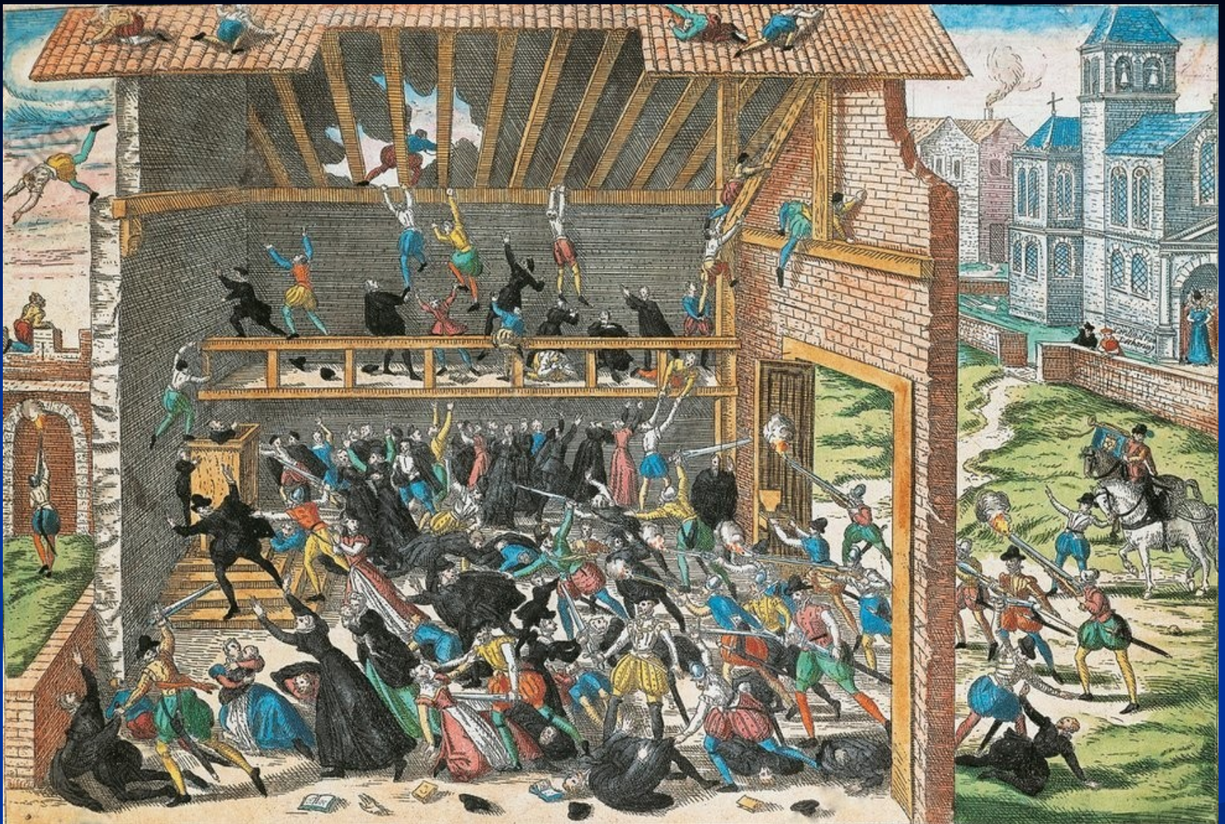
Autre exemple : Wassy-en-Der 1562-2023